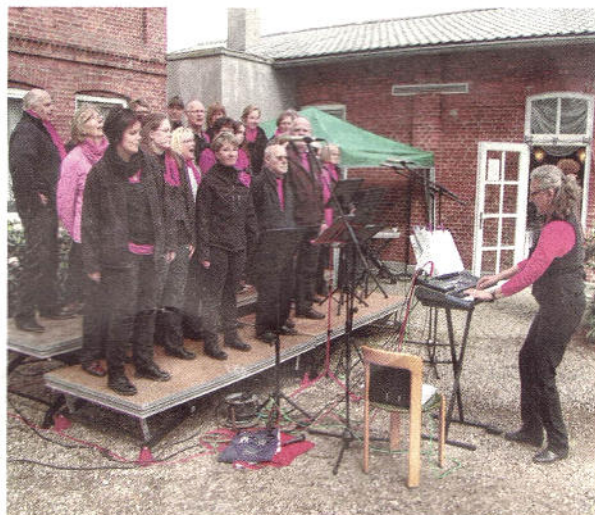
Sorgte für musikalische Unterhaltung: Der GosPop-Chor.